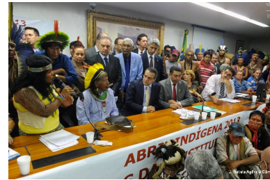
Povos indígenas ocupando o congresso em Brasília