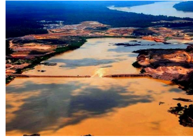
Construção de hidroelétrica de Belo Monte

Hi deputado tõpõ, hi senador tõpõ ï naha kui tõpõnõ Sanõma samakõ ulipõ naha garimpeiro tõpõ, fazendeiro tõpõ, ña tõpõ kui, tõpõ simõa sinomo wi itä kua. Winaha deputado tõpõ, senador tõpõ itõpõ pii kuu salo, Artigo 231 tä sanõpa pi topa kõo wi itä kua kule.