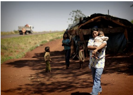
Povos Guarani vivendo na beira da estrada

Amazonia tä ulinaha ai indígena tõpõ hai itä uli sai kua. Maaki Amazonia tä uli kule, itole tõmõ ai indígena tõpõ kule itõpõ hai ï uli tä uli sai kua totiami. Guarani Kaiowa tõpõ hai ï uli tä uli sai kua totiami, kutenõ tõpõ hikalimo wi itä kuami, tõpõ hinomo wi itä kuami, tõpõ namõhuu wi itä kuami, ñaha Guarani Kaiowa tõpõ ulipõ naha ñaha tä kua. Õnõkutenõ itõpõ pepalo sinomo opatí wi itä kua.