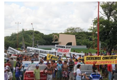
Protesto dos Povos Indígenas em Boa Vista Roraima

Itä sanõa kopalõnõ Sanõma samakõ ulipõnaha fazendeiro tõpõ thakõnõ itõpõnõ Sanõma samakõ hai itä uli hoka totipalõnõ vaca kõkõ pala manõnõ kama sätãnapí tõpõ ulipõ naha ï vaca kõkõ ha totomanõ kama tõpõ hai ï sitipanakõ palamanõ nõ Artigo 231 tä sanõpapi topa wi itä kua. Kami samakõ hai itä ulinaha garimpeiro tõpõ simõanõ ototã tãanõ kama sätãnapí tõpõ ulipõ naha itä simõanõ kama tõpõ hai sitipanakõ tä apitopa salo, sätãnapí pata tõpõnõ Artigo 231 tä piimi. Kami samakõ hai itä ulinaha hiitipõ hãnõnõ kama tõpõ hai itä ulinaha ï hiitipõ asawõsõ simõanõ kama tõpõ hai sitipanakõ palama pitopa salo, kama tõpõ hai ï tõpõ simõa pitopa sinomo wi itä kua.