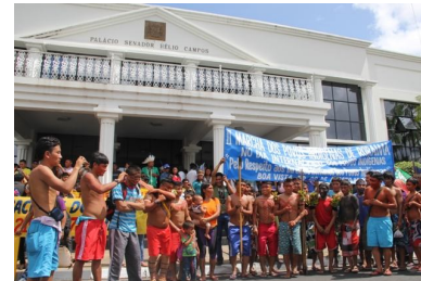
Protesto dos Povos Indígenas em Boa Vista Roraima